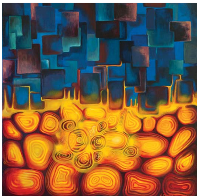
Energie Země – zachycuje energii Země ve své podstatě, žhavé zemské jádro, železnou rudu, kterou z podzemí získáváme, na povrchu tavíme a produkujeme z ní polotovary jako železné ingoty, které dále zpracováváme.