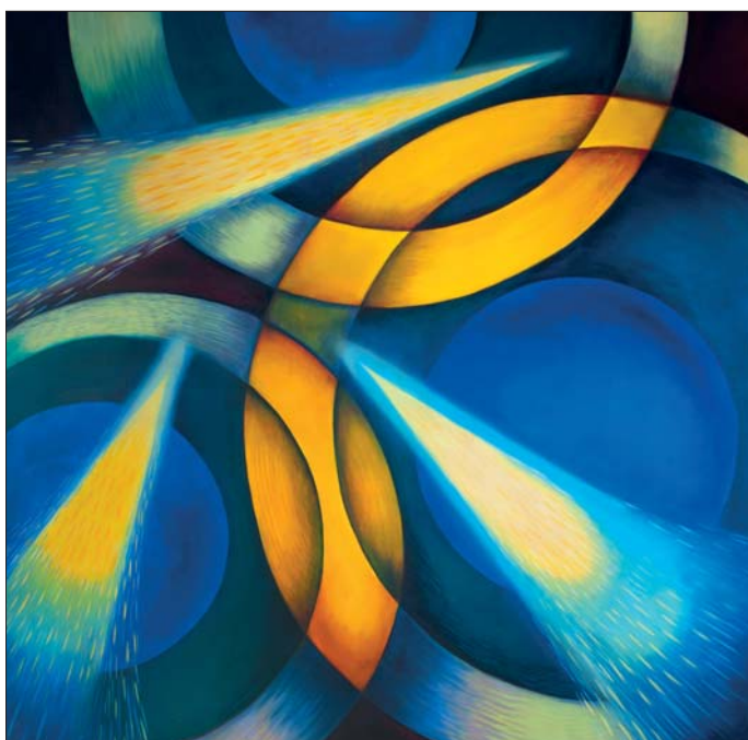
Přeměna paprsku – vyjadřuje proces svařování, přeměnu paprsku v tepelnou energii, pomocí níž tvoříme nové produkty, inspirací byly procesy probíhající v naší svařovně.