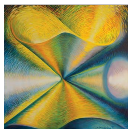
Nekonečná energie – zaznamenává energii ve všech podobách, je nekonečná, schopna neustále měnit svou podobu, přelévat se z jedné formy do jiné. Stačí si ji uvědomit a cítit.